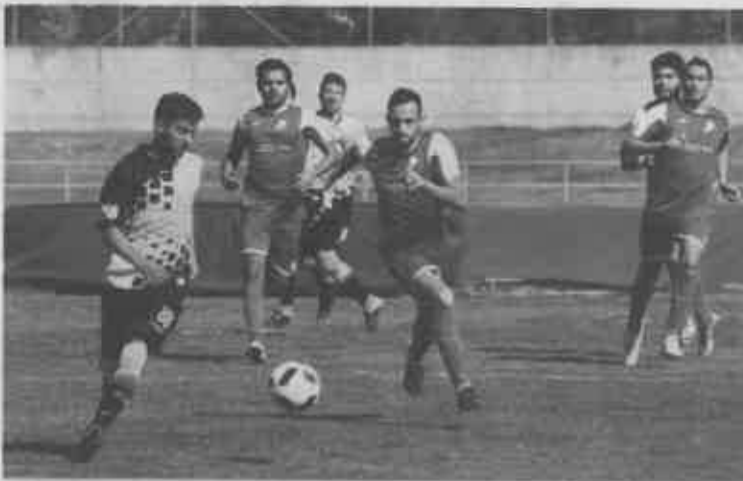
Foi um jogo intenso entre abrantinos e moçarrienses, vencido pelos primeiros.

Quem pode ter acordado para a vida é o União de Santarém que, depois das duas derrotas compro-