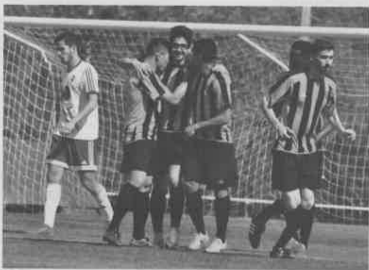
O Alcanenense obteve uma importante vitória em casa frente ao Vilafranquense.

O jogo ficou decidido na primeira parte, com o Alcanenense a entrar logo a ganhar com um golo logo aos