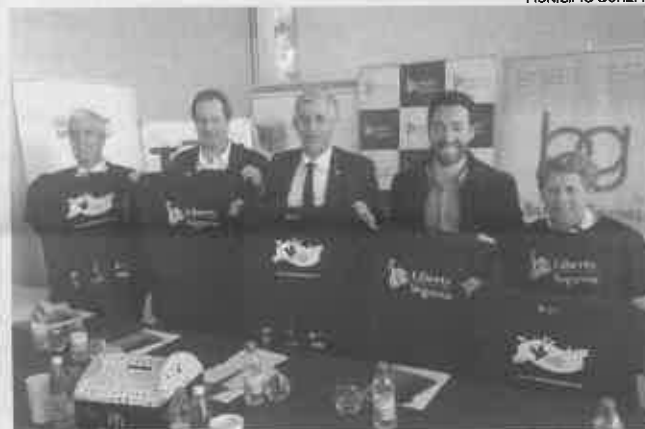
Edição deste ano foi apresentada em Fevereiro