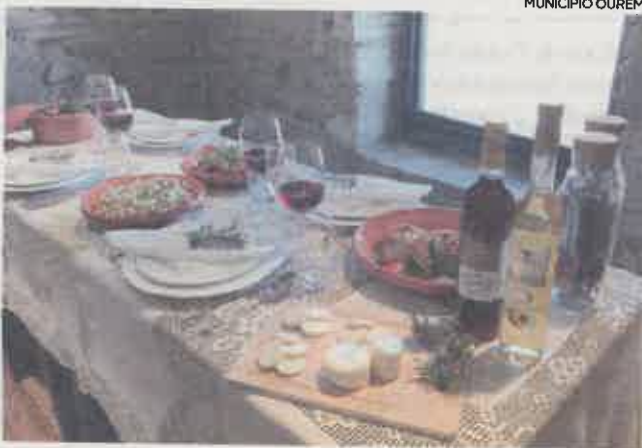
Lista dos 49 pré-finalistas é conhecida amanhã

A 'Mesa de Ourém' engloba vários pratos, entre eles, a 'Brendeira', petisco feito com uma parte da massa da cozedura da broa ou pão de milho; as 'Sopas de Verde', associadas aos dias de festa e feitas com