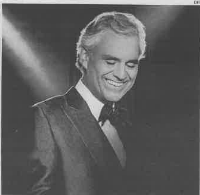
Andrea Bocelli irá brindar os peregrinos com a sua música

guiu fazer do bel canto um dos géneros mais ouvidos em todo o mundo, com êxitos tão importantes como Con te Partirò, interpretará Pietà, de Stradella; Sancta Maria, de Mascagni; Páris Angelicus, de Frank, Mission de Morricone; Ave Maria de Schubert, Agnus Dei, de Bizet e outras canções".