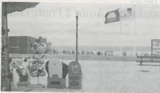
Paredes da Vitória volta a conquistar bandeira azul

Bandeira Azul atribuiu galardões a 332 praias e a 18 marinas, mais quatro do que no ano passado, e a sete embarcações ecoturísticas. As mais de 300 praias estão distribuídas por 86 concelhos, sendo 299 praias costeiras e 33 praias fluviais.