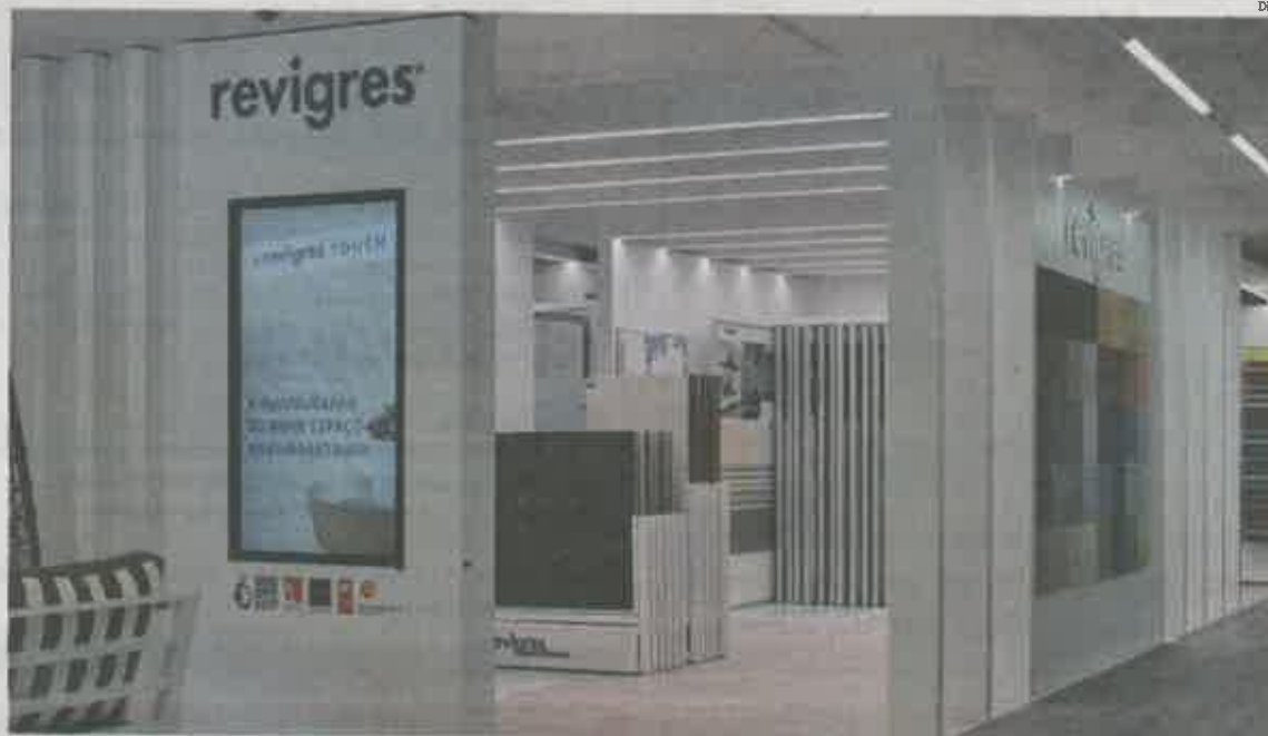
RevigrésTouch foi apresentado sábado na loja BigMat Jofeper

E a Revigrés acrescenta ainda que o conceito "combina a inovação e design da marca em várias áreas que respondem às necessidades, em simultâneo, de profissionais e consumidor final: ambientes reais que reflectem as últimas tendências do design de interiores e funcionam como inspiração para os visitantes;