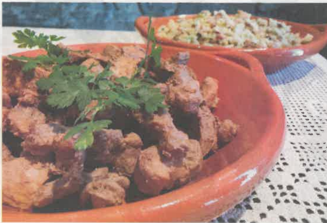
Friginada é um dos pratos típicos que ainda continua a ser servido em restaurantes

O 'Vinho Medieval de Ourém' é um vinho ligeiro, fino e macio no beber. Elaborado maioritariamente com uvas brancas bem maduras, possui aromas de vinho branco, bem 'cassados' com aromas de tinto.