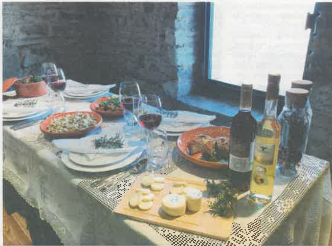
O mundo rural inspira muito da gastronomia do concelho de Ourém

Por sua vez, as gerações mais jovens, "imbuídas de um espírito de revitalização e 'reinvenção' da tradição", recuperam e dão continuidade às receitas dos pais e dos avós, com novas interpretações ajustadas ao mundo con-