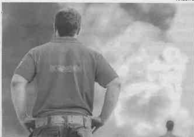
Incêndio deflagrou na madrugada de 3 de Outubro

O incêndio desse dia consumiu uma habitação implantada em zona florestal, que pertencia