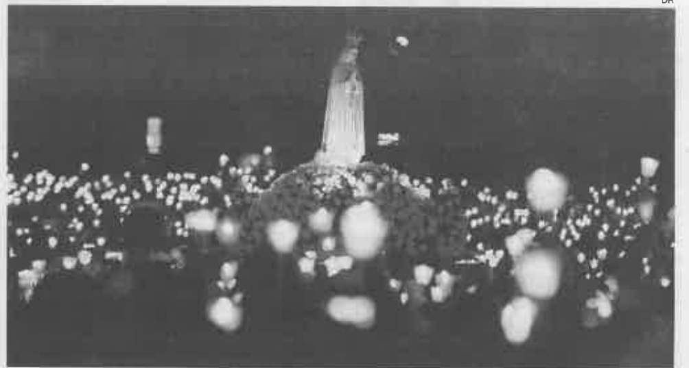
Peregrinação de Outubro tem reunido milhares de pessoas no santuário de Fátima

HOJE O bispo de Hiroshima, Alexis Mitsuru Shirahama, preside hoje e amanhã à peregrinação internacional aniversária (12 e 13 de Outubro) na Cova da Iria, onde são esperados milhares de peregrinos.