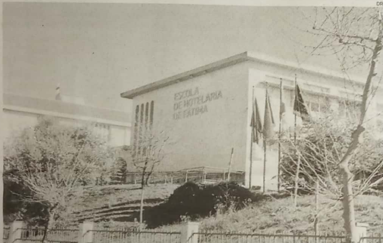
Escola de Hotelaria de Fátima prevê construir novas instalações, tendo já terreno para o efeito

Educação Sem capacidade para receber mais alunos, EHF vai criar pólo no colégio de São Mamede, que, no próximo ano lectivo, ficará desocupado