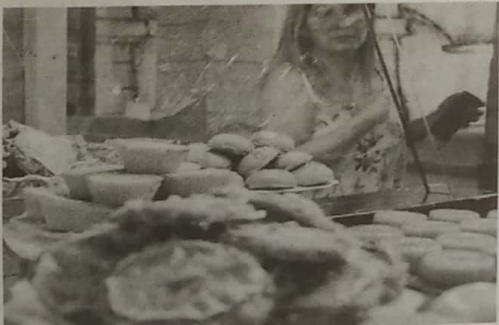
Evento de doçaria conventual acontece no Convento de N.ª Sr.ª do Carmo

O primeiro dia será preenchido com o workshop infantil de decoração de bolachas e com animação pela Oficina de Teatro de Condeixa. Já a tarde de domingo será abrilhantada pelo Grupo Leirena Teatro em parceria com diversas colectividades locais que levarão a