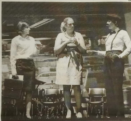
Encenação foi um dos atractivos do evento

Em declarações ao nosso jornal, a comissária frisou que o evento é “uma forma de aconselhar a comunidade para os vários tipos de burla”, uma pro-