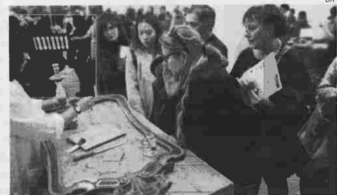
CEARTE divulgou artesanato e património portugueses

FORMAÇÃO O Centro de Formação para o Artesanato e Património - CEARTE, com pólo de formação em Alvaiázere, esteve presente na AR&PA - Bienal Ibérica do Património Cultural, que decorreu em Valladolid (Espanha), para divulgar o artesanato e património portugueses. O convite à participação surgiu por parte da Comissão de Coordenação e Desenvolvimento Regional do Centro (CCDRC).