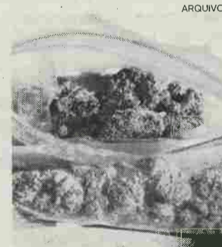
Suspeito tinha na sua posse 90 doses de haxixe

Em comunicado, o Destacamento Territorial da GNR de Caldas da Rainha, refere que a detenção do indivíduo, surgiu na sequência de uma acção de patrulhamento efectuado na madrugada do sábado passado (01h00) pela GNR da Benedita, que depois de o abordarem demonstrou "um comportamento suspeito". Na sequência de uma fiscalização ao veículo, as autoridades apreenderam 90 doses de haxixe e 620 euros em numerário. "A informação de que dispomos é que os suspeito, residente na zona de Cal-