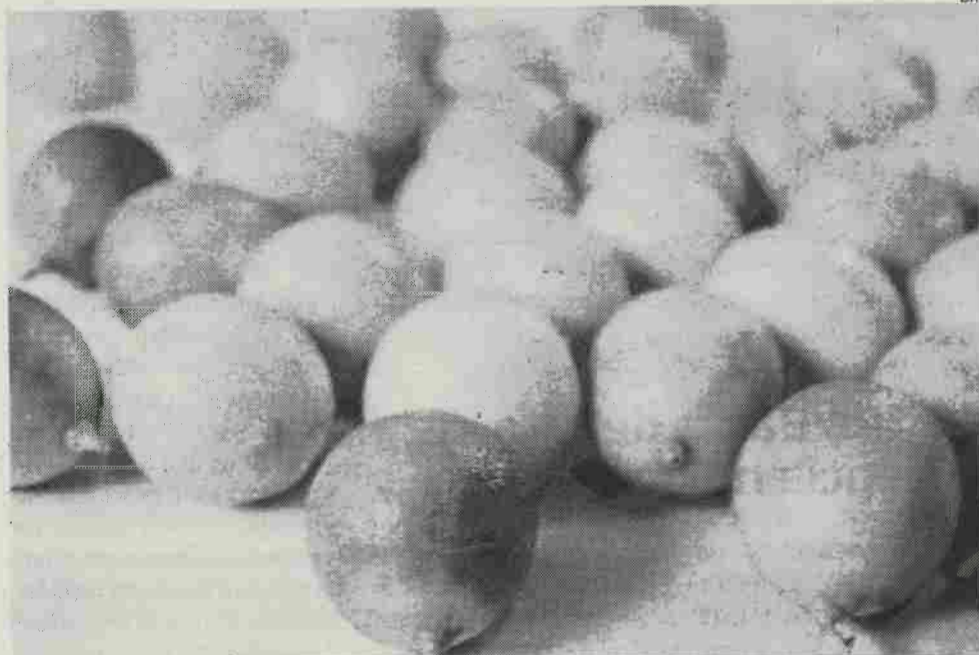
Praga provocada por um insecto africano ataca limoeiros, laranjeiras e tangerineiras

A autarquia marinhense revela que a Direcção Regional de Agricultura do Centro emitiu um alerta para proprietários de citrinos isolados e pomares onde se estabelecem medidas de combate e controlo desta praga, salientando a proibição da entrada no País de material de propagação de citrinos provenientes de países onde seja conhe-