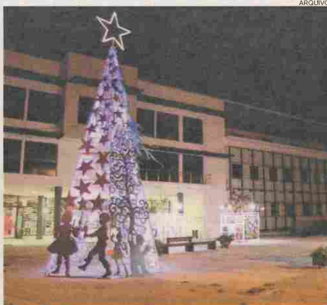
Iluminação de Natal é uma 'obrigação' nesta altura do ano

No dia 9, decorrerá um desfile na Avenida D. Nuno Álvares Pereira, em Ourém, aquando da chegada do Pai Natal, que