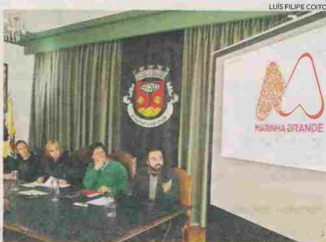
Sessão de apresentação da nova marca marinhense

Para a autarca, os marinhenses são um povo “lutador e trabalhador”, sendo a Marinha