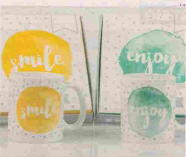
Venda dos artigos reverte, com um euro, a favor dos projectos vencedores da edição de 2018/2019

Assim, neste Natal “voltam a estar disponíveis nas lojas do distrito de Leiria caixas de bombons e canecas e, por cada