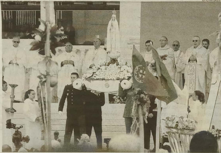
Escultura permitiu que o Santuário “se aproximasse dos peregrinos de todo o mundo”

“Numa primeira fase desta análise, para perceber o estado de conservação do suporte e detectar intervenções passadas