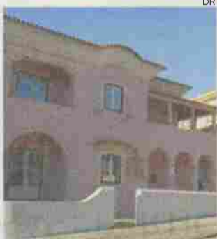
Biblioteca Municipal de Porto de Mós foi alvo de várias obras de requalificação

A autarquia adiantou que no decorrer das obras “alguns dos serviços foram reorganizados e foi, ainda, implementado um