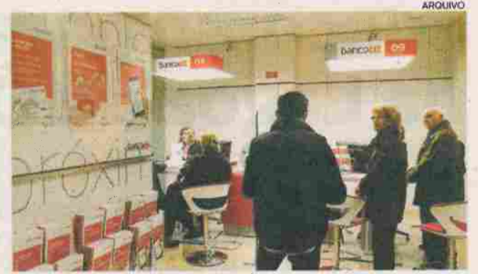
Banco CTT foi reconhecido pelo seu serviço

GALARDÃO O Crédito Habitação do Banco CTT foi considerado pelos portugueses como um serviço de excelência, tendo sido reconhecido com o Prémio Cinco Estrelas 2019. Entre os cinco bancos avaliados na mesma categoria, o Banco CTT ficou em primeiro lugar nos critérios de satisfação, preço-qualidade, recomendação e inovação.