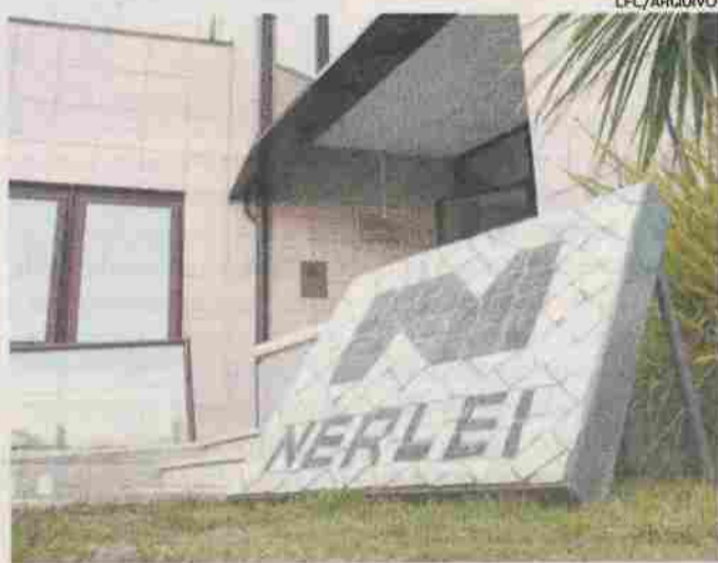
Nerlei apoia 56 empresas em feira que arranca na sexta-feira

No sábado, está agendada a visita às empresas portuguesas presentes na feira pelo secretário de Estado da Economia,