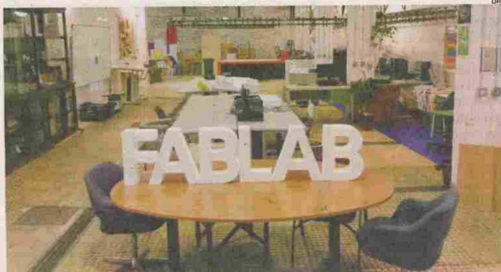
FAB LAB pretende apresentar soluções inovadoras para proporcionar os meios necessários para a criação de um ambiente de criatividade

"O FAB LAB de Porto de Mós tem por objectivo principal dis-