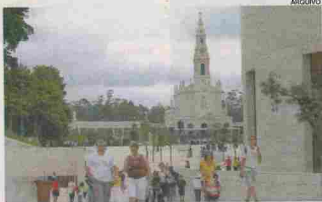
Santuário de Fátima é a entidade promotora do evento

O programa terá início a partir das 16h30, com missa na Capela da Morte de Jesus, seguindo o encontro no salão da