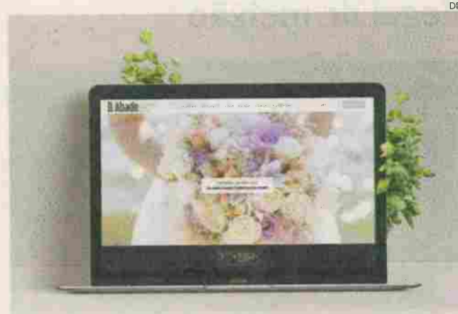
Imagem foi criada pela empresa de Leiria Sistema4

INOVAÇÃO O restaurante D. Abade, no concelho de Porto de Mós, fez uma actualização da sua imagem institucional, num trabalho da agência de comunicação leiriense Sistema4, que pretende reflectir uma óptica de modernização.