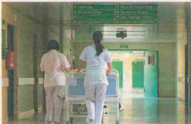
Deco Proteste avaliou experiências de 1.723 utentes em todo o país