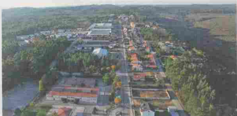
A Zona Industrial de Chã (Caxarias) vai ser ampliada

A ampliação da Zona Industrial de Caxarias, a instalação e fixação de empresas na Zona Industrial de Casal dos Frades e a instalação da StartUp-Ourém, são três das prioridades do município de Ourém na área do desenvolvimento económico do concelho.