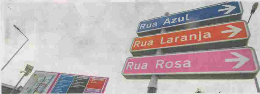
Parque do Camporês será ampliado com mais 27 lotes

O município de Alvaiázere pretende requalificar e alargar da Zona Industrial de Troia e avançar com uma área empresarial nova em Rego da Murta, na freguesia de Pussos São Pedro, uma vez que o concelho não possui espaços para alojar unidades empresariais .