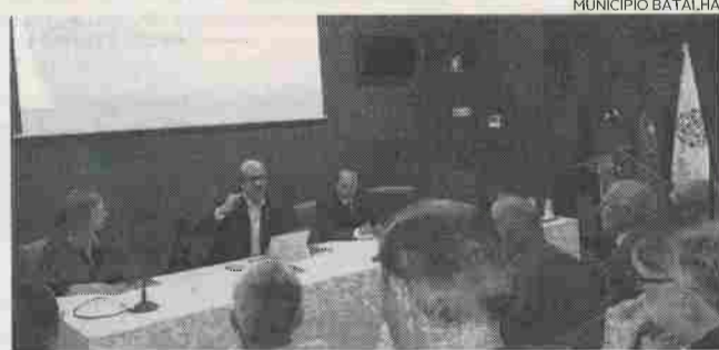
Guia foi apresentado esta segunda-feira, em Lisboa

O documento, elaborado nas línguas portuguesa e inglesa,