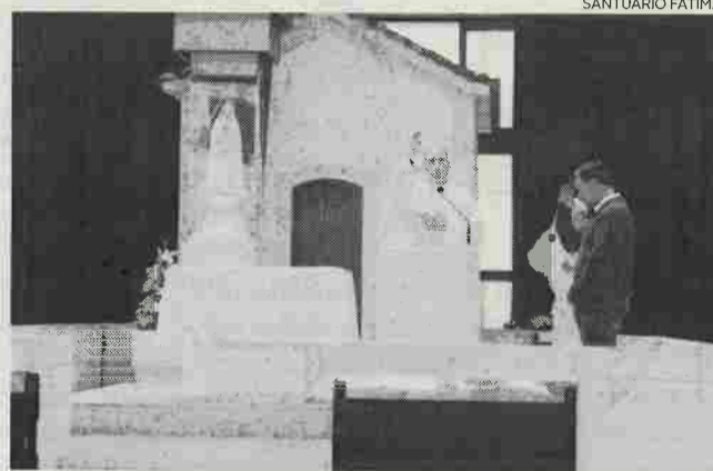
Périplo pela Argentina estende-se até meados de 2020

FÁTIMA A Imagem Virgem da Peregrina N.º 10 partiu para a Argentina na manhã desta segunda-feira. A Capelinha das Aparições, no Santuário de Fátima, foi o lugar para uma pequena cerimónia de envio.