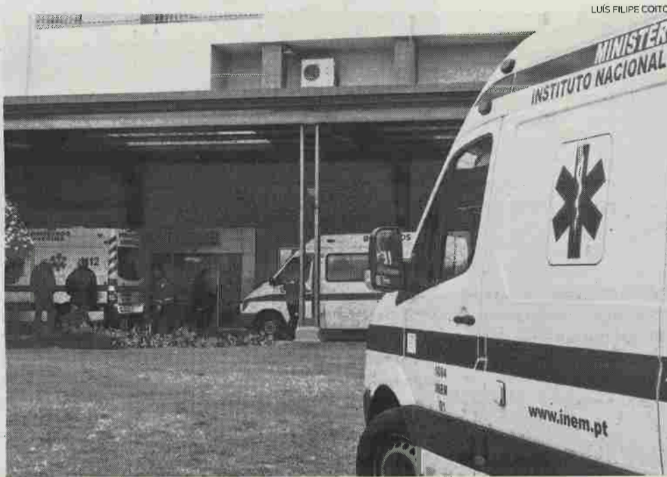
Serviço de Urgência do Hospital de Leiria tem sofrido uma elevada afluência de utentes

Outro dos temas abordados entre o autarca e a ministra da Saúde foi a situação do Centro de Saúde de Ourém, tendo a tutelar da pasta da Saúde mostrado “abertura para num futuro próximo existir um reforço de meios, que permita voltar a disponibilizar um serviço de urgências”. Deste modo, os utentes do concelho de Ourém poderiam fazer um primeiro rastreio no Centro de Saúde e, possivelmente, evitar o encaminhamento para os hospitais da região. Para a ar-