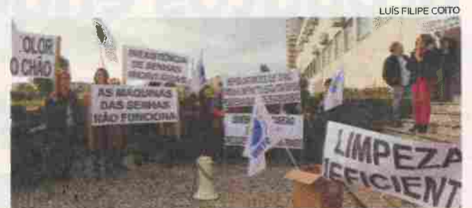
População manifestou-se na passada segunda-feira