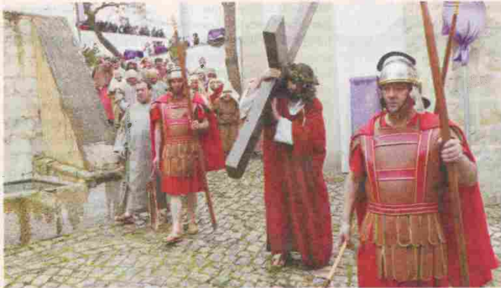
Via-sacra envolve mais de uma centena de actores amadores e figurantes da comunidade local

Semana Santa Via-sacra é considerada uma das melhores recriações do País e sai à rua este ano pela 20.ª vez