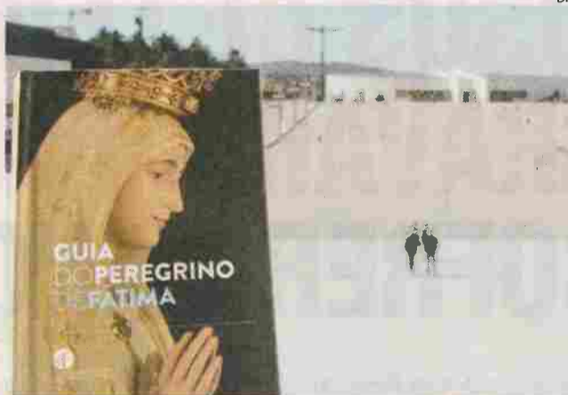
Livro está disponível "nas principais livrarias do País"

O livro, disponível "nas principais livrarias do País" e no 'site' do Santuário, tem cerca de 200 páginas e "reúne contributos para melhor conhecer o acontecimento e a mensagem de Fátima, preparar uma peregrinação e percorrer os espaços do Santuário, com a ajuda de mapas e infografias".