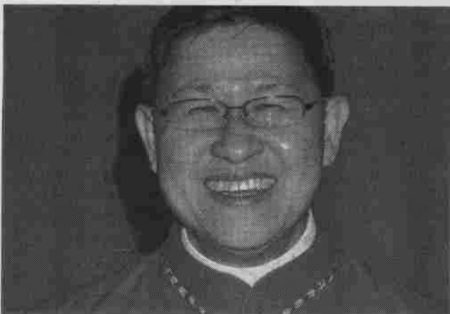
Cardeal D. Luis Antonio Tagle preside às cerimónias

O cardeal filipino D. Luis Antonio Tagle, arcebispo de Manila, vai presidir à peregrinação internacional de Maio a Fátima, anunciou ontem o Santuário.