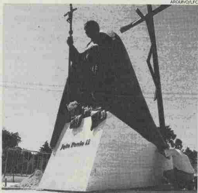
13 de Maio recorda o dia da aparição de Fátima e coincide com o atentado contra a vida de São João Paulo II

No momento em que fez a saudação aos peregrinos de língua portuguesa, o Papa recordou que Maio é considerado pelos católicos como o