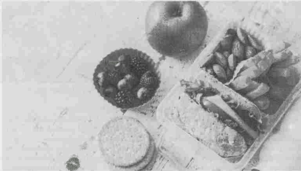
Objectivo do desafio é mudar os comportamentos alimentares para soluções mais saudáveis

“Três dias à Campeão: 0% açúcar, 100% saudável!” sugere, em alternativa aos habituais lanches calóricos de alimentos processados (carregados de sal e açúcares), lancheiras para a