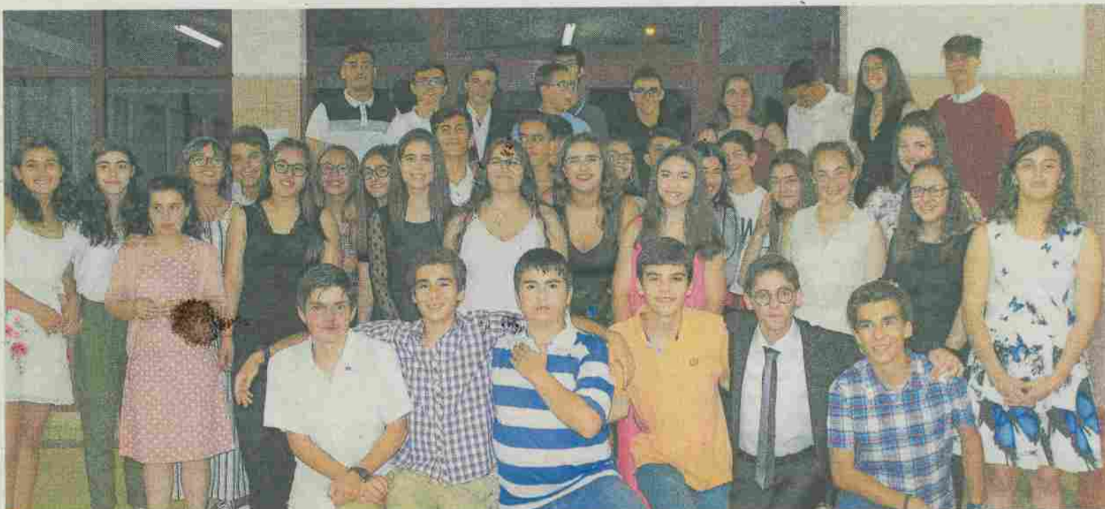
Grupo de finalistas da Escola Básica dos 2.º e 3.º Ciclos Santa Iria