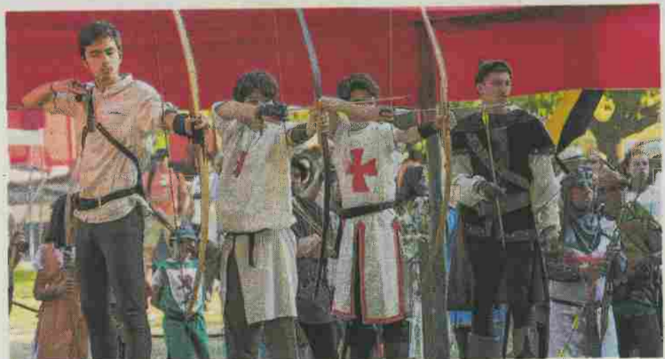
Nesta feira foi possível experimentar o tiro ao arco, entre outras atividades