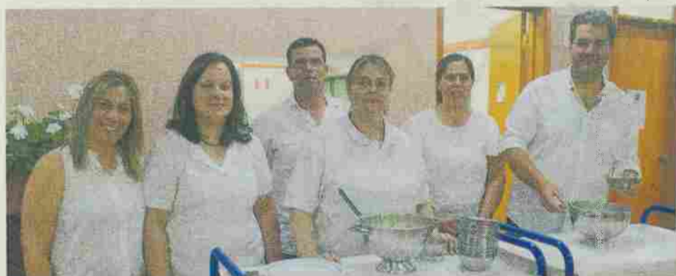
Comissão de pais, professores, funcionários e pais organizaram o jantar

ram o respetivo diploma e as emoções falaram mais alto e a festa prolongou-se muito além da meia-noite (naquele dia tinham autorização!).