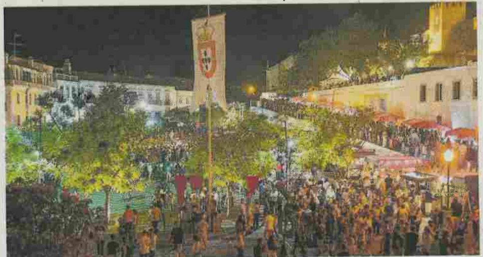
Torres Novas recebeu, entre 29 de maio e 2 de junho, mais uma Feira de Época

À semelhança de outros anos, a população foi chamada a vestir-se a rigor e a passear pelo certame, integrando o espírito da época, onde foi possível experimentar o tiro ao arco ou uma luta de es-