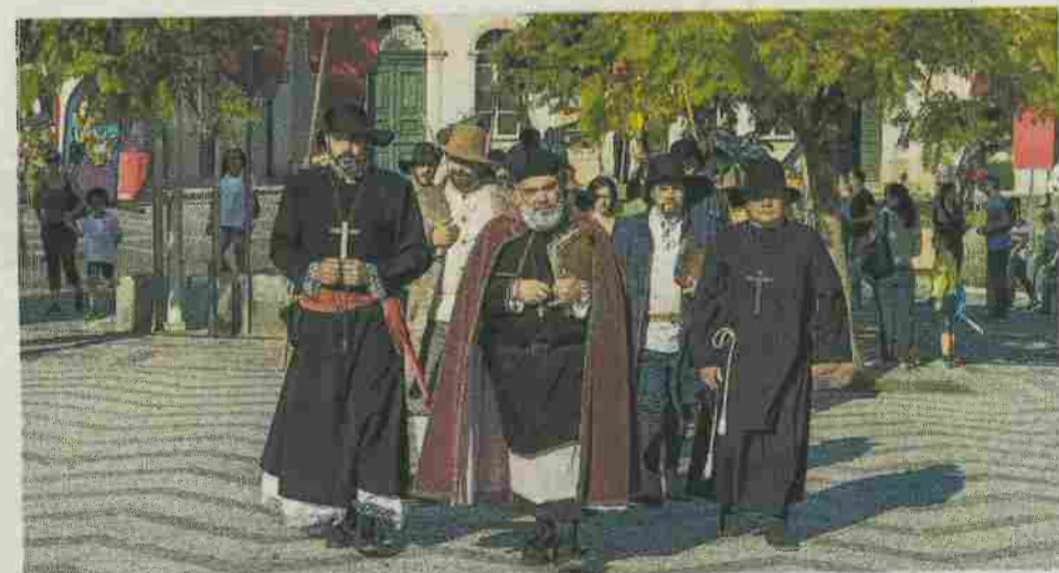
O tema de mais uma Feira da Época recaiu sobre a inquisição

padas, além de uma grande variedade de jogos tradicionais, num espaço dedicado aos mais novos no interior