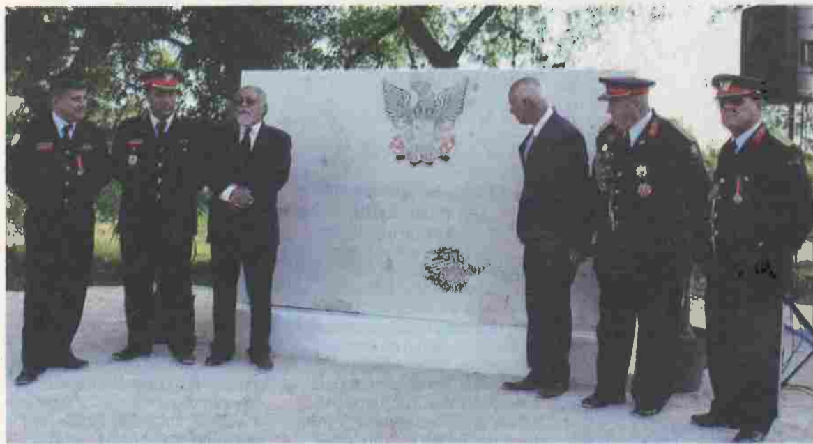
Corporação espera ter quartel concluído em 2022

Os Bombeiros Voluntários de Fátima celebraram no domingo, 30 de junho, os seus 16 anos de formação, com uma cerimónia na estrada da Moita do Martinho, em Fátima, nos terrenos adquiridos