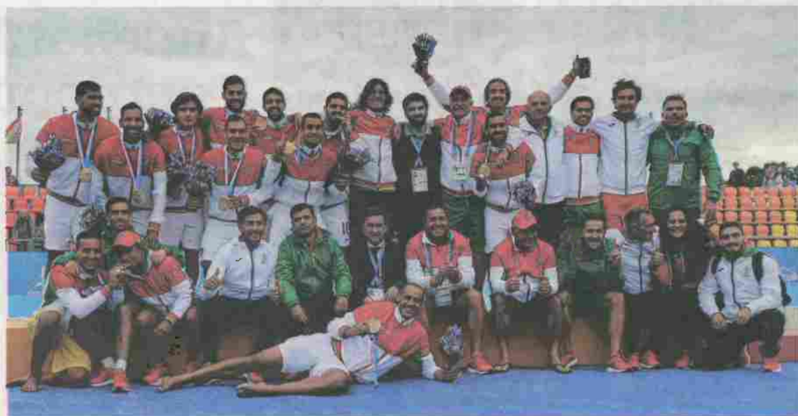
Leiria arrecada ouro em futebol de praia, em Minsk, e em boccia, na Finlândia