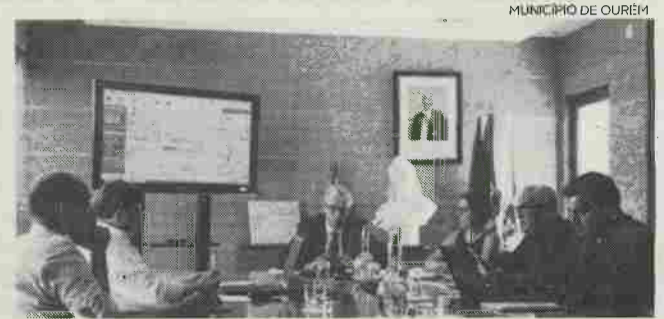
Projecto foi aprovado em reunião de Câmara

Num comunicado, o município refere que o projecto "visa estimular sectores do concelho de Ourém, transportando jovens universitários, empresas ourensenses e o próprio município para uma realidade tridimensional, fortalecendo a dinâmica e a atractividade" do concelho, através de uma po-