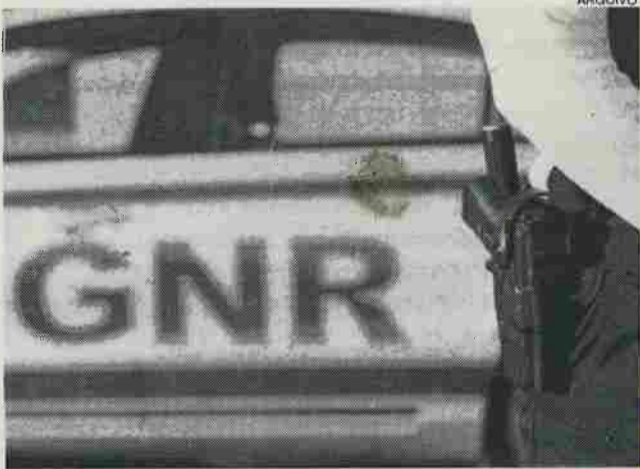
Destacamento Territorial de Pombal encabeçou a operação

Para além da detenção dos indivíduos, na sua maioria com antecedentes criminais pela prática de crimes de várias naturezas, os militares da GNR apreenderam três veículos automóveis, oito mil euros em dinheiro, diversas quantidades