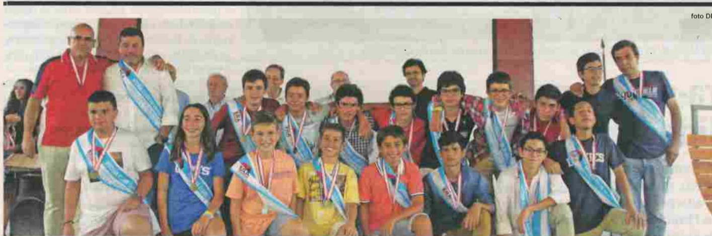
Iniciados foram um dos escalões consagrados na “Gala do Dia do Vitória”

enquanto Entidade Formadora de Futsal de 4 Estrelas por parte da Federação Portuguesa de Futebol, o apuramento inédito para o Campeonato Nacional de Iniciados de 2019/20, a convocatória de dois atletas para a Selecção Nacional Sub-15 ou a conquista do estatuto de 2º maior emblema de todo o país em número de atletas de futsal federados, além do funcionamento em pleno da sua nova sede social, traduzido na oferta de diversas novas modalidades.