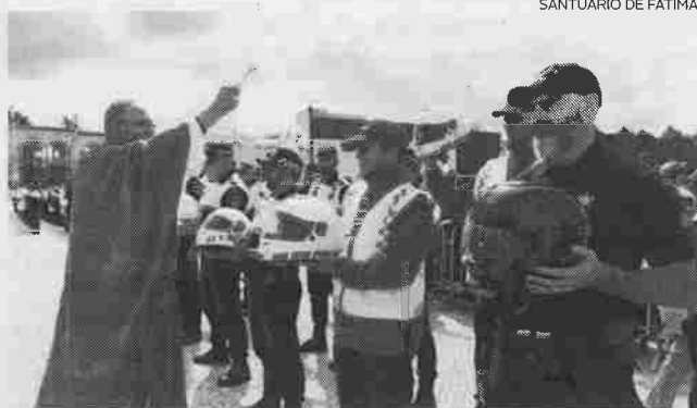
SANTUÁRIO DE FÁTIMA

"A quantos correm velozes pelas estradas do mundo com as suas esplêndidas motas, obras-primas da inteligência e da técnica, encorajo a elevar o pensamento e o afecto para a sua celeste padroeira, Nossa Senhora dos Motociclistas, sentido que Ela-como boa Mãe, a quem o próprio Jesus confiou a humanidade inteira- exorta-os ao respeito de toda a pessoa, ao amor, à caridade recíproca, a jamais pôr em perigo a própria vida e a dos demais, a moderar a pressa, a impaciência, a euforia da velocidade para nunca serem causa de lágrimas e sofrimento", refere o texto da Bênção Apostólica concedida pelo Santo Padre, o que acon-