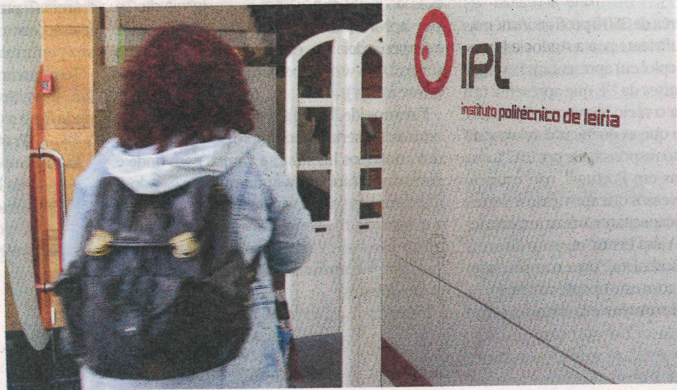
Politécnico tem ainda 12 cursos com vagas para a terceira fase do concurso nacional de acesso

Nas cinco escolas do Politécnico de Leiria há 12 cursos ainda com vagas, nomeadamente Relações Humanas e Comunicação Organizacional