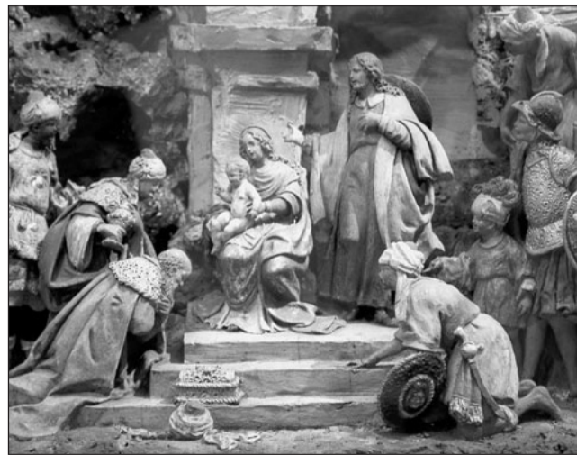
Adoração dos Magos – Estilo Barroco – Século XVIII é uma das imagens expostas na Sala da Natividade

o único credenciado pela Rede Portuguesa de Museus na cidade de Fátima, pode ser efectuada diariamente, excepto à