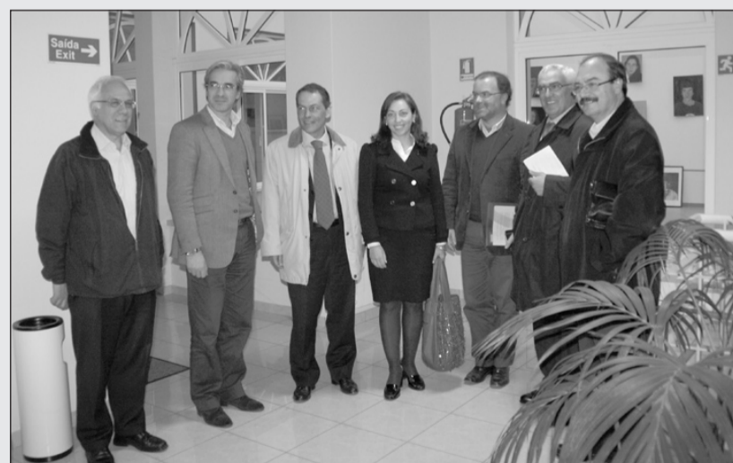
Deputados social-democratas durante a visita que efectuaram a Fátima

Esta carta surge na sequência de uma visita, seguida de reunião, que os deputados efectuaram aos estabelecimentos de ensino particular e cooperativo de Fátima. A reunião visou debater e recolher informação, sobre as alterações propostas pelo Governo.