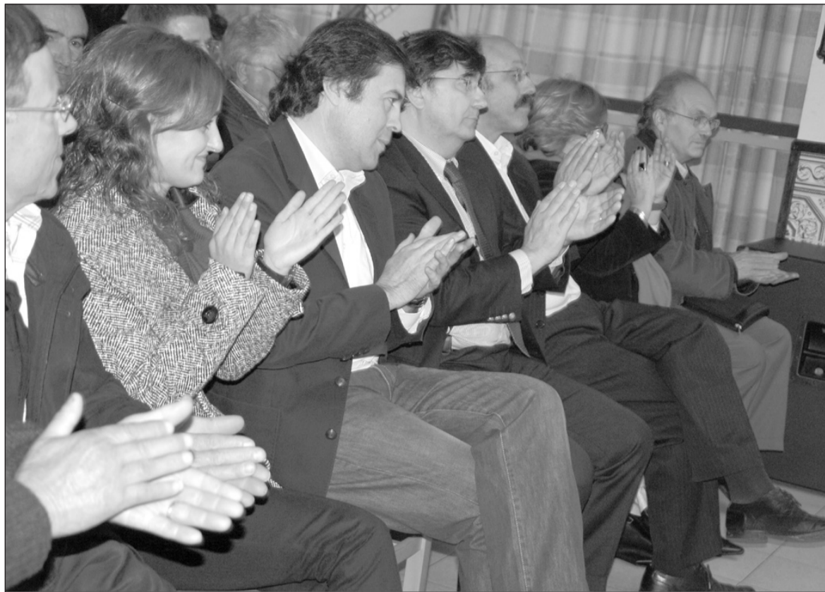
Entidades felicitaram Eirapedrense por mais um aniversário

Foi em ambiente de grande confraternização e alegria que o Eirapedrense comemorou sábado, 20 de Novembro, a passagem do seu 22º aniversário. À semelhança dos anos anteriores, a festa começou com o hastear da bandeira, seguido de uma missa celebrada pelo padre Sousa, que pediu às crianças e jovens que garantam o futuro desta colectividade, que se orgulha de ser um dos principais pontos de encontro da população local.