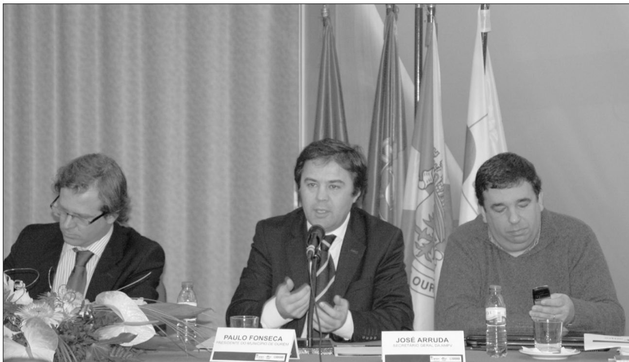
Iniciativa foi organizada pela Associação de Municípios Portugueses do Vinho