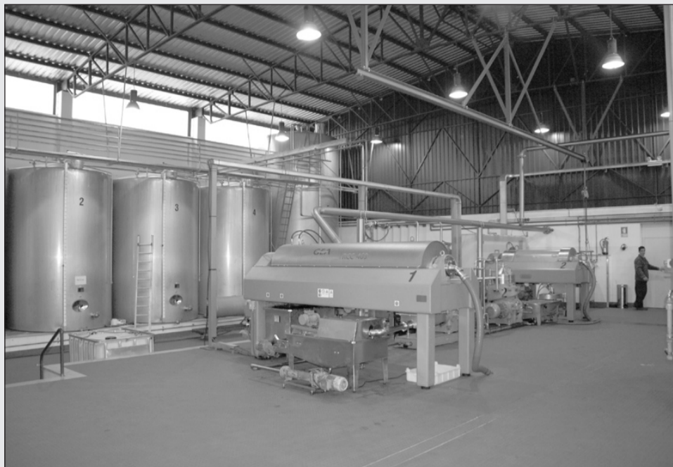
A Cooperativa de Olivicultores de Fátima recebeu até à data cerca de 2500 toneladas de azeitona