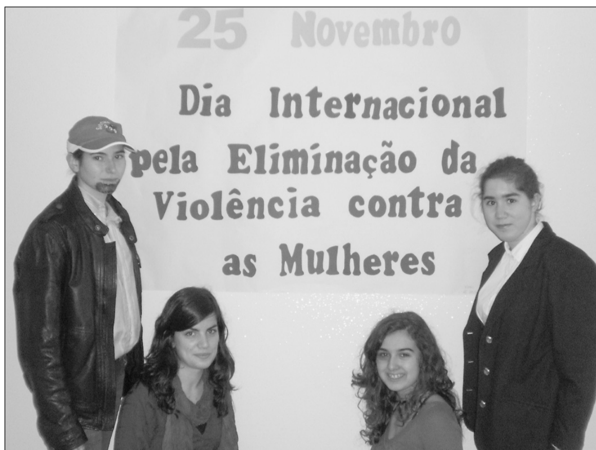
A iniciativa partiu de um grupo de alunos do CEF

Dentro deste projecto, o grupo de alunas já está a preparar outras actividades, para levar a cabo ao longo do ano lectivo, entre as quais se destaca a realização de uma conferência, que contará com um elemento da GNR habituado a lidar com este tipo de situações, uma vítima e um psicólogo criminal. Em princípio, a iniciativa será aberta à população.