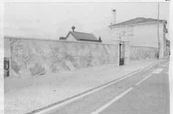
Mural foi inaugurado no último dia do ano, marcando também um encerramento simbólico de um ano especial para Fátima

NOVIDADE Um mural de homenagem ao povo de Fátima foi inaugurado, no último dia do ano, junto à Igreja Paroquial de Fátima, marcando o encerramento de um ano particularmente especial para aquele local, pela celebração do Centenário das Aparições.