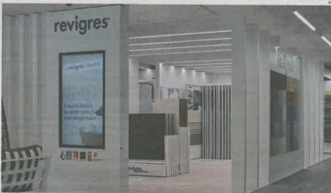
RevigrésTouch foi apresentado sábado na loja BigMat Jofeper

E a Revigrés acrescenta ainda que o conceito "combina a inovação e design da marca em várias áreas que respondem às necessidades, em simultâneo, de profissionais e consumidor final: ambientes reais que reflectem as últimas tendências do design de interiores e funcionam como inspiração para os visitantes;