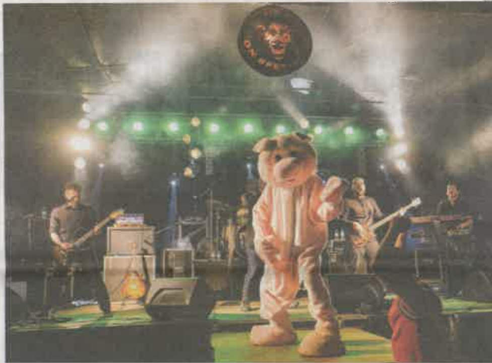
Festival teve a sua primeira edição em 2006 e já recebeu dezenas de artistas

Na quinta onde será realizado o festival, vai ser também possível visitar um moinho movido a água para a produção de farinha, que actualmente ainda se encontra em funcionamento.