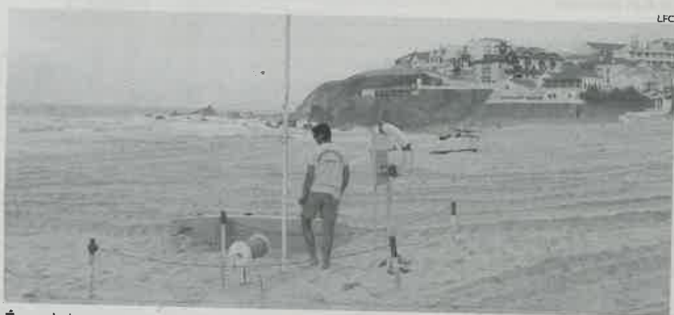
Época balnear arrancou dia 1 de Junho

O concelho da Marinha Grande foi um dos mais prejudicados com os incêndios de outubro de 2017, que consumiram mais de 80% da Mata Nacional de Leiria. O parque de campismo de Vieira de Leiria foi também afectado pelas chamas, mas estará a funcionar em pleno durante o Verão. "Houve efectivamente algumas partes afectadas, nomeadamente ao nível da entrada e paços exteriores, que já se encontram totalmente resolvidas". Por isso, o "parque de