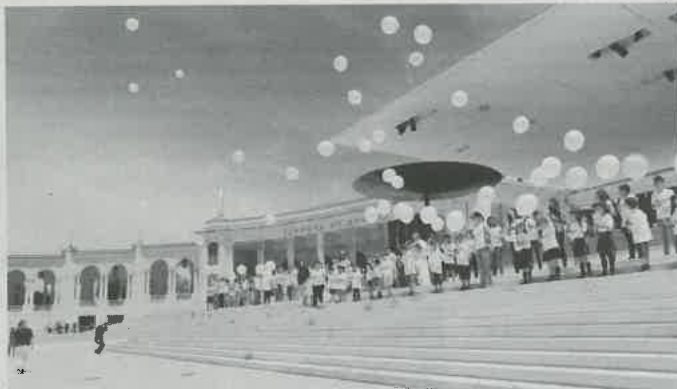
Peregrinação começa amanhã à noite mas o ponto alto é a eucaristia de domingo

A peregrinação é precedida por uma campanha, lançada no mês de Abril. Nessa altura, o Santuário faz chegar às paróquias que manifestarem interesse desdobráveis com o programa da peregrinação, cartaz, folhetos relativo à campanha do mês de Maio e o hino da peregrinação, de modo a que, durante o mês de Maio, o dia da