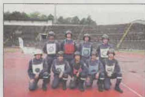
Batalhão de Sapadores Bombeiros do Porto (B)