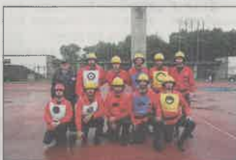
Bombeiros Voluntários de Paço de Sousa (A)