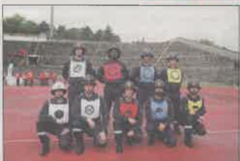
Regimento de Sapadores Bombeiros (A)