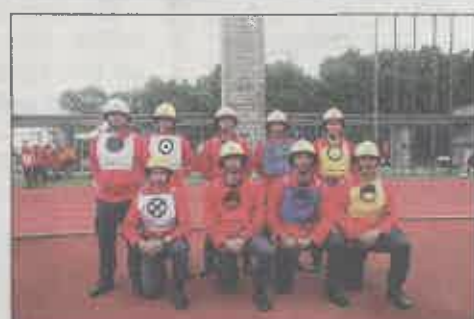
Bombeiros Voluntários de Ribeira Grande (A)