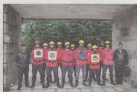
Bombeiros Voluntários de Rebordosa (A)