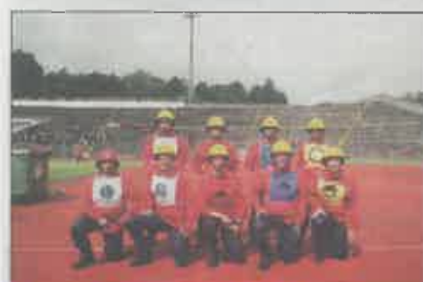
Bombeiros Voluntários de Ourém (A)