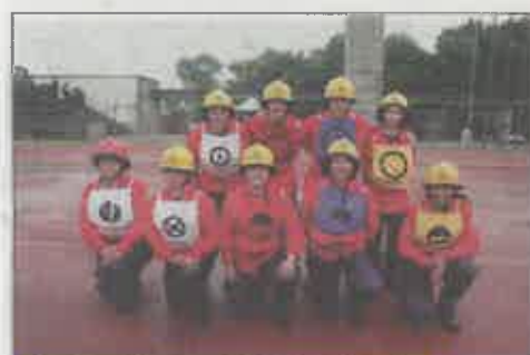
Bombeiros Voluntários de Ourém (Femininos)