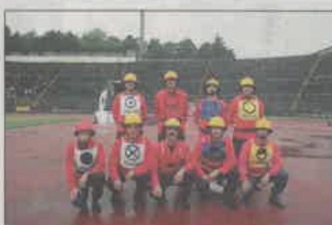
Bombeiros Voluntários de Marco de Canaveses (B)