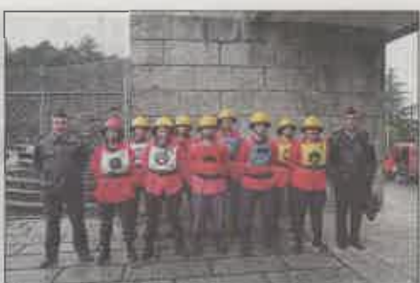
Bombeiros Voluntários de Rebordosa (Femininos)