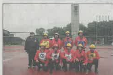
Bombeiros Voluntários de Ribeira Grande (B)