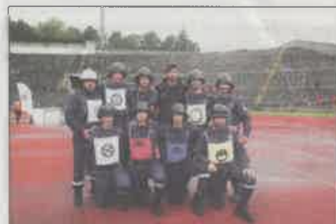
Batalhão de Sapadores Bombeiros do Porto (A)