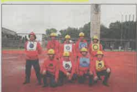
Bombeiros Voluntários de Ourém (B)