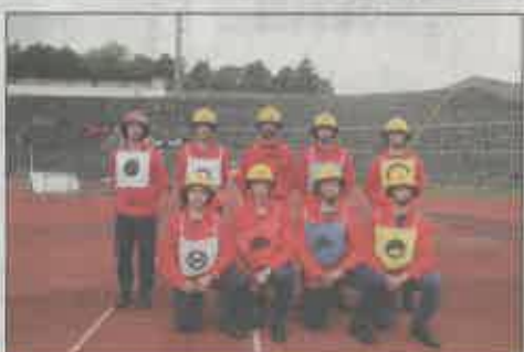
Bombeiros Voluntários de Fátima (A)