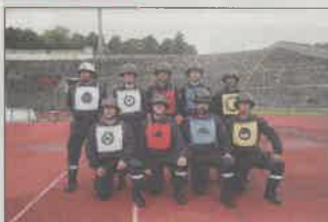
Regimento de Sapadores Bombeiros de Lisboa (B)