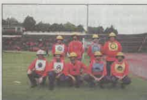
Bombeiros Voluntários de Montemor-o-Novo (A)