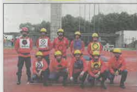
Bombeiros Voluntários de Marco de Canaveses (A)