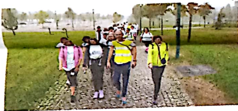
Cerca de meia centena de pessoas aderiram à iniciativa

MARINHA GRANDE Cerca de meia centena de pessoas marcaram presença na caminhada "na memória da Marinha Grande". Numa iniciativa da Alzheimer Portugal, com o apoio da Câmara marinhense, a caminhada teve como objectivo angariar fundos para aquela associação e "conscientizar para a importância de reduzir o risco de desenvolver demência, para os sinais de alerta da Doença de Alzheimer e, sobretudo, para a importância do diagnóstico atempado". A acção inseriu-se nas comemorações do 30.º Aniversário da Alzheimer Portugal, que agendou caminhadas solidárias em 67 locais de Norte a Sul de Portugal, incluindo os arquipélagos dos Açores e da Ma-