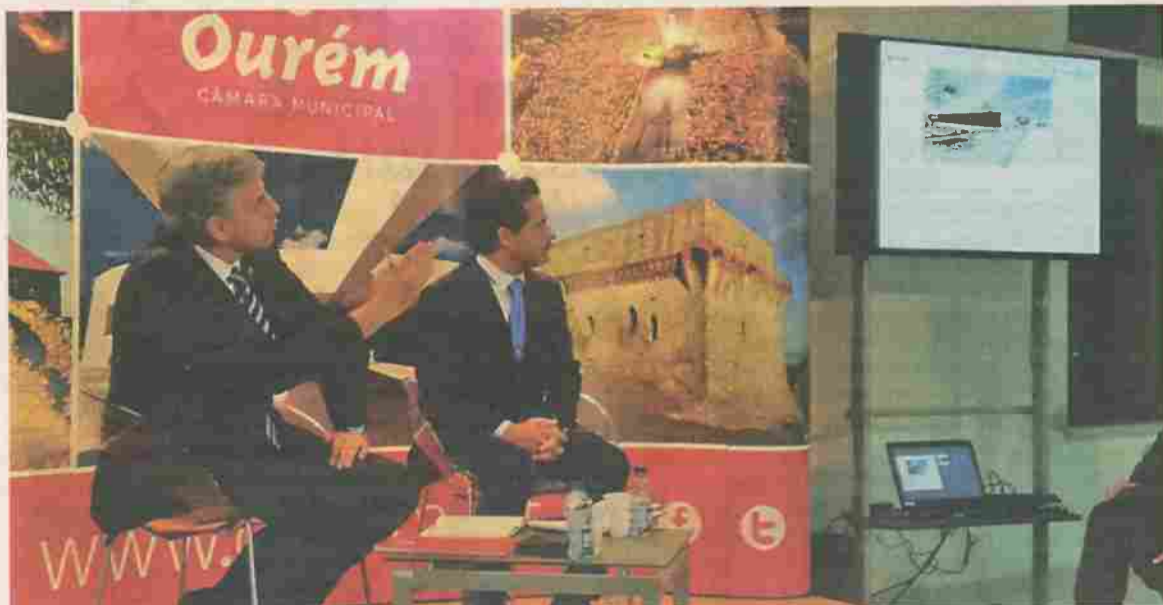
População ouviu projetos do município para Caxarias