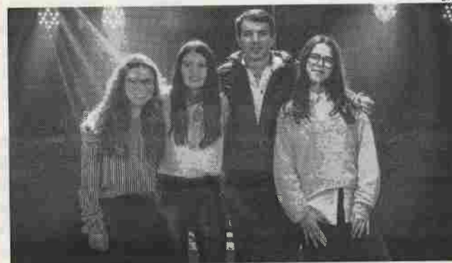
Grupo actua gratuitamente em festas de carácter religioso

MÚSICA Os 'Discípulos de Fátima' iniciaram o novo ano com a aposta no 'mundo' digital. O projecto musical católico português sediado em Fátima tem agora uma página no Facebook e um canal no YouTube, para se dar a conhecer e aos seus projectos musicais.