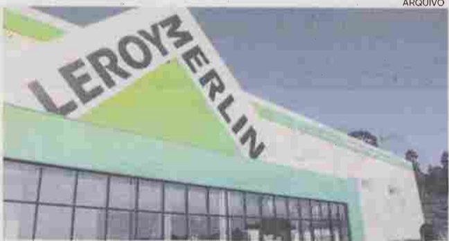
Fusão pretende fazer evoluir os modelos de negócio das empresas

No âmbito deste processo de convergência, a ADEO, detentora das duas empresas nacionais, a Bricodis - Distribuição de Bricolage, e a BCM - Bricolage que exploram, respectivamente, as insígnias Aki e Leroy Merlin, fundiu as duas empre-