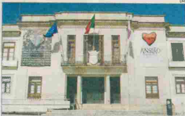
Transferências do Governo para a Câmara foram aprovadas com a abstenção dos deputados do PSD

Os deputados do PSD na Assembleia Municipal de Ansião, em linha com a posição dos vereadores sociais-democratas no executivo camarário, absteram-se na votação sobre a transferência de competências do Governo para o município. Os sociais-democratas justificam a abstenção com a "indefinição sobre as contrapartidas financeiras a transferir para os municípios, por oposição à postura do PS", ao ter decidido "aprovar a transferência