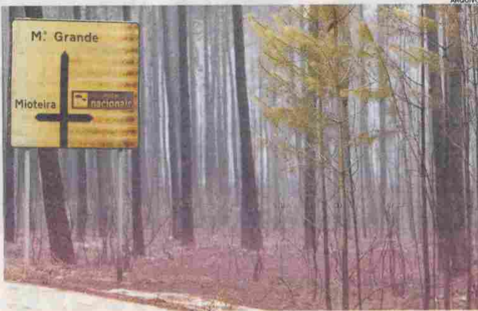
Chamas consumiram mais de 85 por cento das matas nacionais