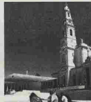
Evento vai receber cerca de 1.000 participantes