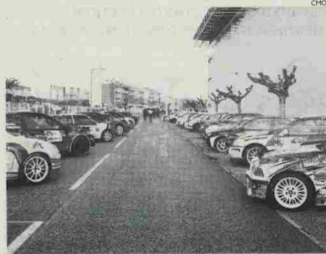
Organização está a preparar zonas específicas para o público

“Trata-se de mais um projecto de natureza desportiva e base turística, que continua a