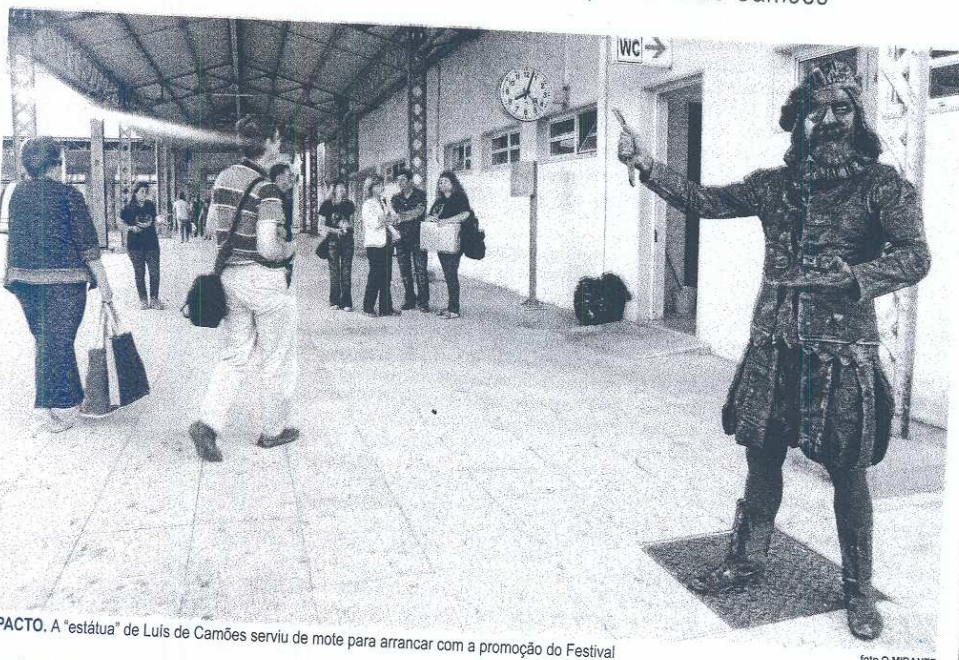
IMPACTO. A "estátua" de Luís de Camões serviu de mote para arrancar com a promoção do Festival

Iniciativa decorre em Setembro e foi apresentada por "Luís de Camões"