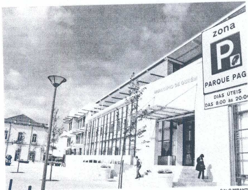
INDEMNIZAÇÃO. Apesar de nunca ter iniciado os trabalhos, a empresa teve alguns prejuízos

A Câmara de Ourém vai ter que pagar 5.259 euros a um empreiteiro que está há dois anos à espera que a autarquia crie as condições para avançar com as obras de ampliação do sistema de esgotos da zona do campo de futebol