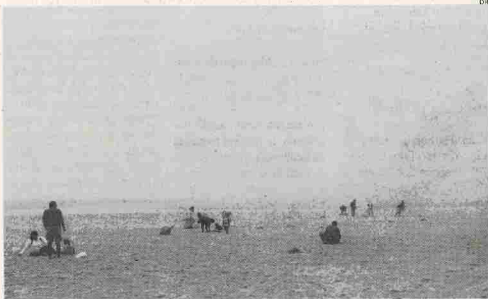
Limpeza na Praia Foz do Arelho faz parte do programa

da Universidade recebe o concerto 'Caldas Jovem'.