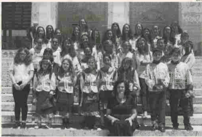
Schola Cantorum é uma das presenças confirmadas

Inserida no programa pastoral 2018-2019, com o tema 'Dar graças por peregrinar em Igreja', a iniciativa pretende "promover e valorizar a prática musical religiosa de crianças e jovens, através de uma dinâmica de intercâmbio e enriquecimento de experiências e conhecimentos, com outras formações corais, diferentes realidades e modelos de trabalho", informou o Santuário de Fátima numa nota de imprensa.