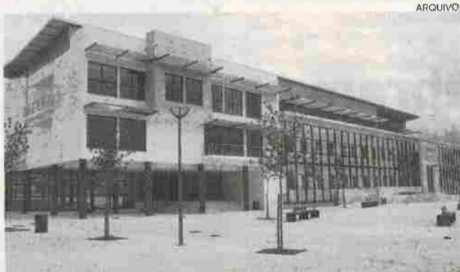
Contas da autarquia foram aprovadas por unanimidade

Em relação ao limite da dívida total a margem face ao limite legal previsto por lei é de 33,1 milhões de euros, quando em 2017 esse valor era de 31,1 milhões de euros, o que significa um acréscimo de 2,9 milhões de euros em relação à ca-