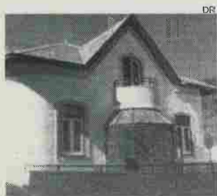
Evento decorre hoje na Casa da Cultura

No evento, que tem início às 14h30, na Casa da Cultura, os alunos do Agrupamento de Escolas de Figueiró dos Vinhos, que estão a participar no projecto apresentam o trabalho desenvolvido em contexto escolar e em colaboração com a