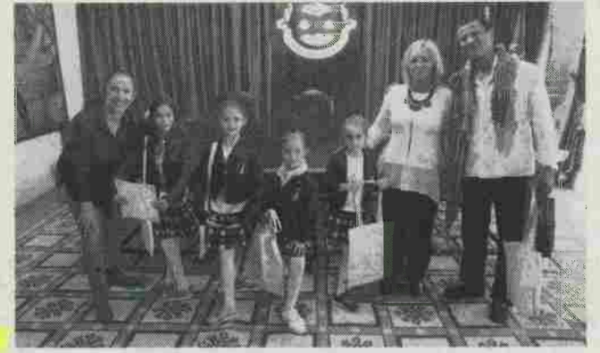
Alunas foram recebidas na Câmara da Marinha Grande

MARINHA GRANDE Alunas da Escola Rans Ballet, com sede na Marinha Grande, foram premiadas no Concurso Internacional de Ballet, em Espanha.