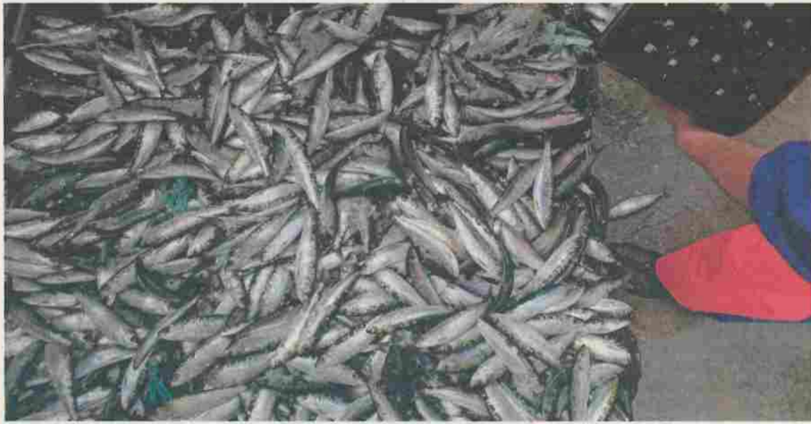
Pesca da sardinha retomada no início de junho