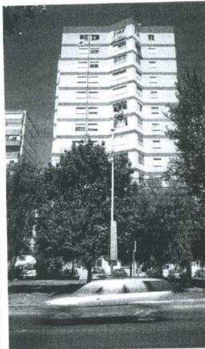
Casa onde ocorreu o acidente era habitualmente frequentada por muita gente