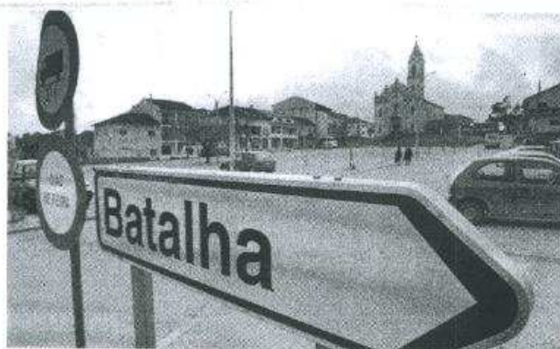
TERRITÓRIO Deputados pedem intervenção da Assembleia

Numa nota enviada à redacção do Diário de Leiria, os deputados dão conta de um "trabalho técnico" desenvolvido pela câmara da Batalha, em conjunto com os municípios de Leiria, Porto de Mós e Alcanena, "com vista à delimitação definitiva entre os respectivos municípios", já que, "não existem