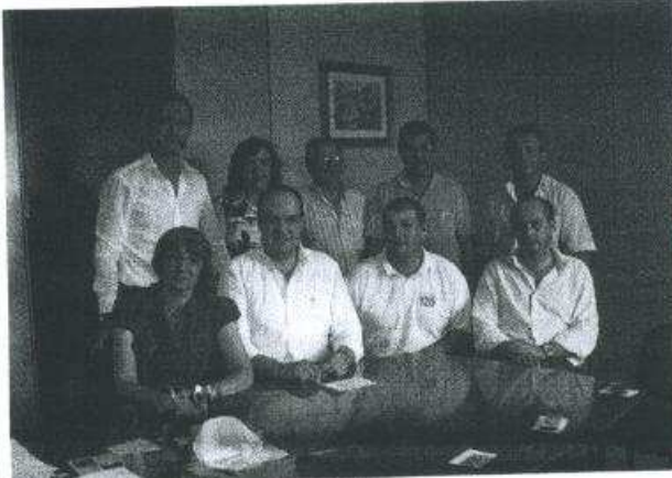
GRUPO DE PESSOAS que fundou a confraria do chicharo