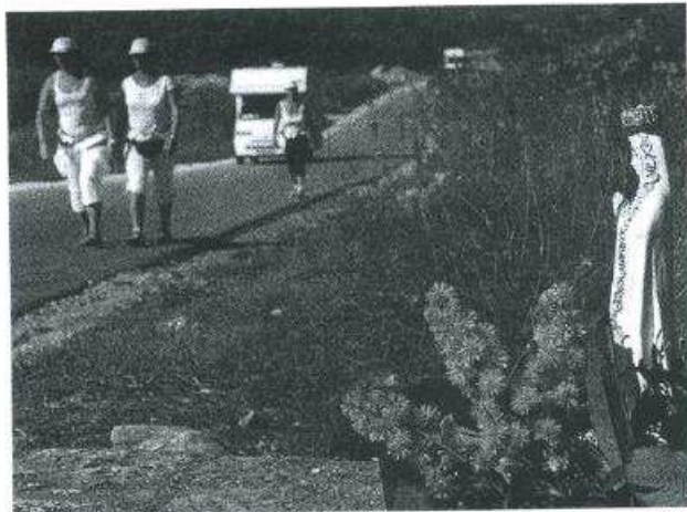
REGIÃO Casa onde residia irmã Lúcia, pastorinha de Fátima, continua a atrair muitos peregrinos

Santuário recupera tradição numa eira junto à casa da vidente Lúcia, provocando a curiosidade e o interesse dos peregrinos