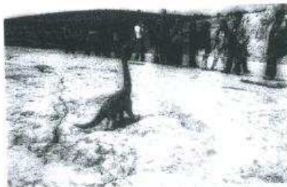
PALEONTOLOGIA Pegadas de dinossauros são motivo de atracção

«A decisão do Comité do Património Mundial de voltar a analisar numa próxima reunião a candidatura dos sítios dos icnofosséis dos dinossauros da Península Ibérica foi considerada positiva pelos representantes de Portugal. A candidatura dos locais de Dinossauros da Península Ibérica inclui oito jazidas em Espanha e três em Portugal, entre as quais a Pedreira do Galinha, na Serra de Aire, Ourém, Vale de Meios e Pedra da Muxa. Numa das trilhas em território português é possível ver pegadas de uma família de dinossauros, havendo vestígios de dois adultos e três jovens animais.