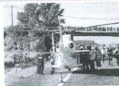
Acidente na A1 provocou a morte a um bombeiro e deixou cinco com ferimentos