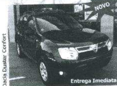
Dacia Duster Comfort