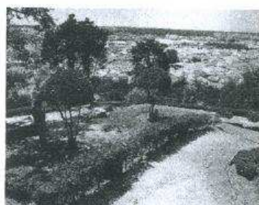
VIGILÂNCIA Projecto decorre na área do concelho de Pombal

O projecto iniciou-se na segunda quinzena de Julho e o encerramento está previsto para o final de Setembro. O número de horas diárias por participante é de cinco horas e meia, correspon-