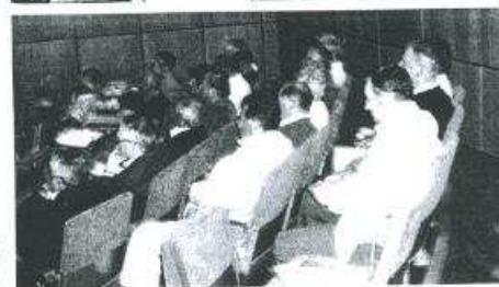
Cerca de cinquenta pessoas assistiram ao colóquio