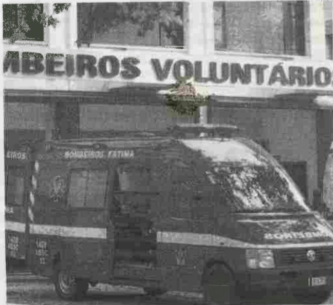
Bombeiros de Fátima estão instalados, actualmente, na cave do edifício do Centro de Saúde daquela freguesia

O parque suplementar de estacionamento das viaturas "dista cerca de 200 metros do quartel e pertence à Congregação dos Missionários do Verbo Divino", sendo que a corporação conta ainda com outros dois locais de estacio-