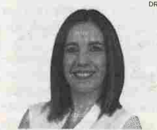
Deputada de 'Os Verdes'

Ainda segundo anunciou, anteontem, a coligação que une comunistas e ecologistas, além da mudança de local de candidatura da líder parlamentar do PEV, que foi a terceira de quatro eleitos no distrito sadino há