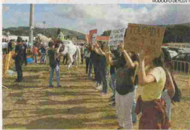
Manifestantes levaram cartazes de protesto contra a tourada

'Diz não à tourada em Porto de Mós' foi o nome do movimento que nasceu naquele concelho e que em menos de um mês contou com mais de 600 apoiantes nas redes sociais e com uma petição de 1.800 assinaturas, adiantou à agência Lusa Inês Amado, munícipe do concelho e uma das organiza-