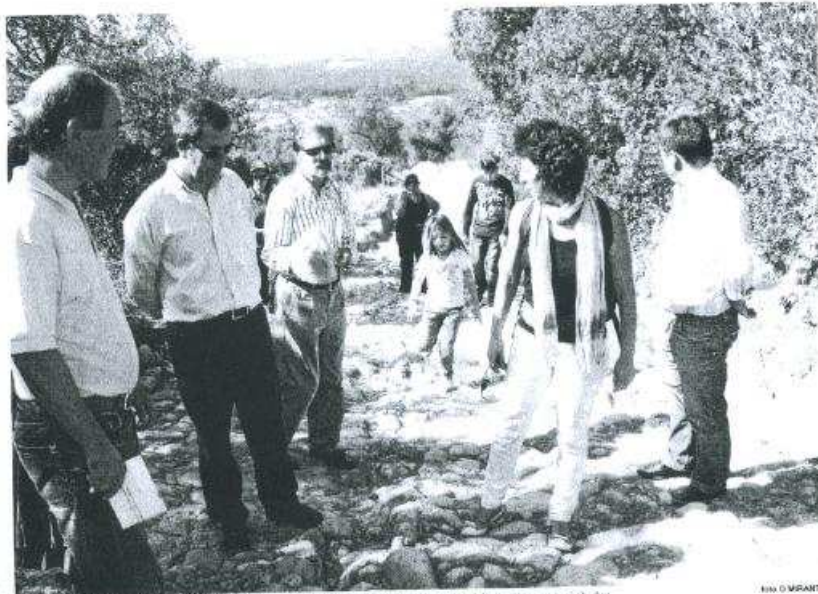
RECUPERAÇÃO. As calçadas medievais foram limpas, requalificadas e estão preparadas para serem visitadas

Os dois percursos foram cortados ao trânsito automóvel e vão ser instalados painéis informativos sobre a envolvente vegetal. Na tarde de sábado, 25 de Setembro, uma pequena cerimónia informal deu a conhecer o novo aspecto dos caminhos.