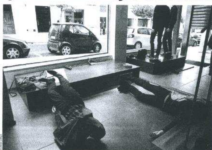
A Five já foi assaltada três vezes

A Aclis - Associação Comercial e Industrial de Leiria, Batalha e Porto de Mós, exige um reforço no poli-