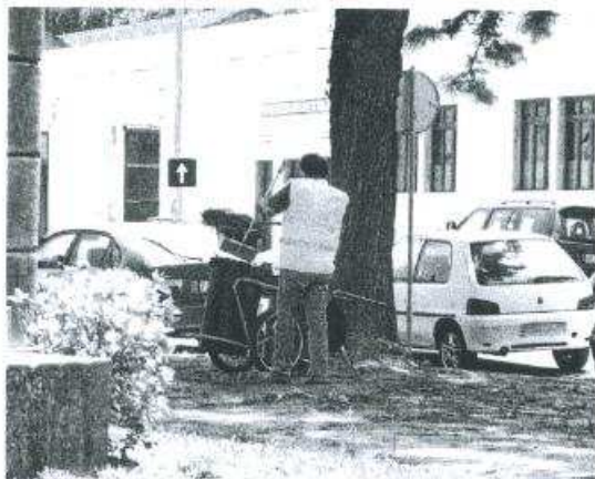
COMPLICADO. Mesmo para funções simples os concursos obrigam a muito estudo

Tomese como exemplo o concurso aberto pela Câmara Municipal do Entrancamento, para duas vagas de Assistente Operacional, cuja função seria a limpeza de instalações e viaturas, que foi publicado no Diário da República, II série, nº 42, de 2 de Março deste ano.