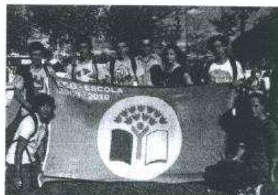
GAZLADA: foi recebido em cerimónia realizada em Ourém