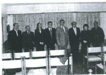
Representantes dos Movimentos Independentes

De referir ainda que a sede desta associação ficará em Tomar, na Av. General Tamagnini.