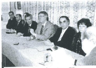
No momento da leitura da escritura pública

Comissão Política da Federação Distrital do PS