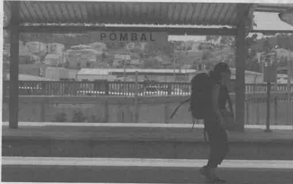
QUEBRA de passageiros no Sud Expresso começou nos anos 80

Nos tempos áureos da emigração portuguesa, na década de 60 do século passado, a estação de Fátima era um corrupio de gente, acrescentou João Guilherme, de 64 anos, o mais antigo