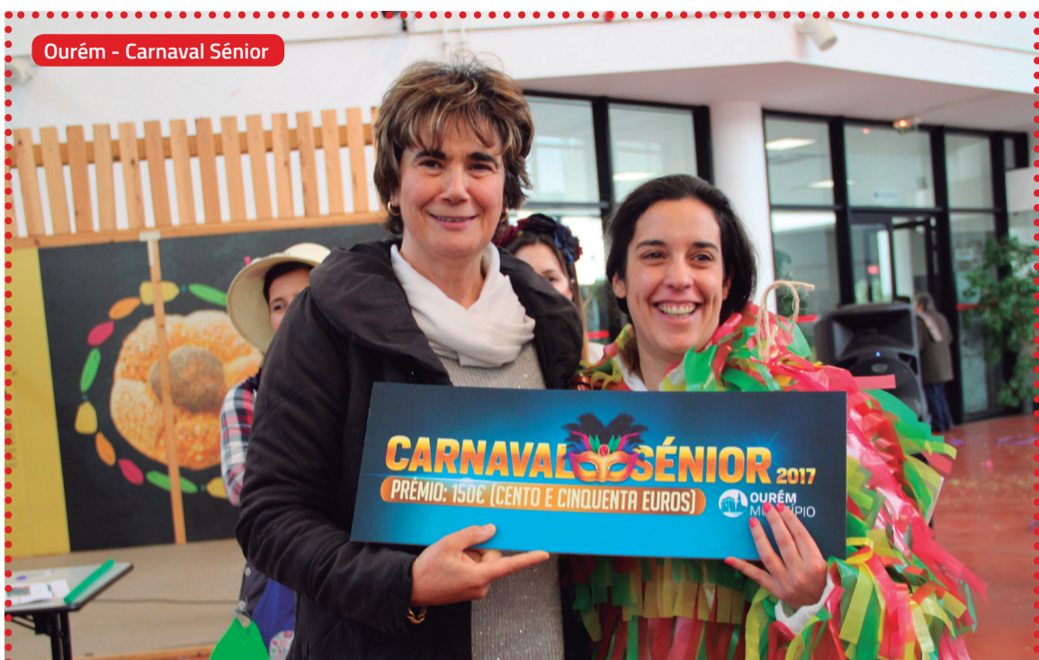
Ourém - Carnaval Sênior