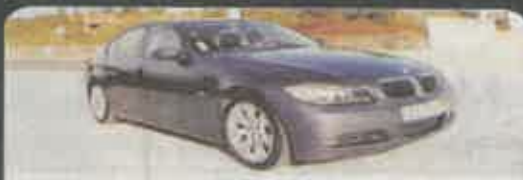
BMW 320D SPORT 163CV Nacional, 2005, bancos em pele e desportivos, full extras