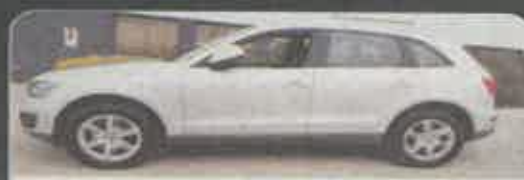
AUDI Q5 2.0TDI SPORT 170cv, nacional, ano 2011, caixa automática, full extras

EN 1 Figueiras Boa Vista | 2400 Leiria | Telem. 914 219 038 | silva.leiria@hotmail.com