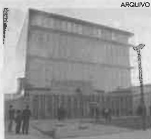
Resultados são apresentados no Auditório da Resinagem

A proposta ou propostas vencedoras serão convertidas