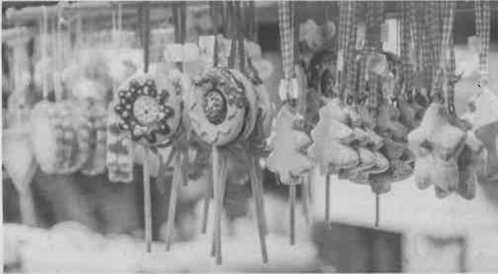
Evento tem lugar no parque 13 do Santuário e a Escola de Hotelaria de Fátima é a anfitriã

Esta é a 26.ª edição do 'Christmas in Europe' e conta com a participação de 21 escolas de