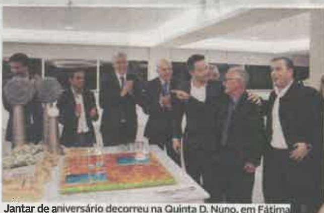
Jantar de aniversário decorreu na Quinta D. Nuno, em Fátima