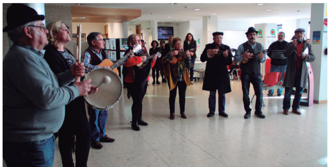
Grupo de Cavaquinhos da A.C.R.D. Moita Redonda