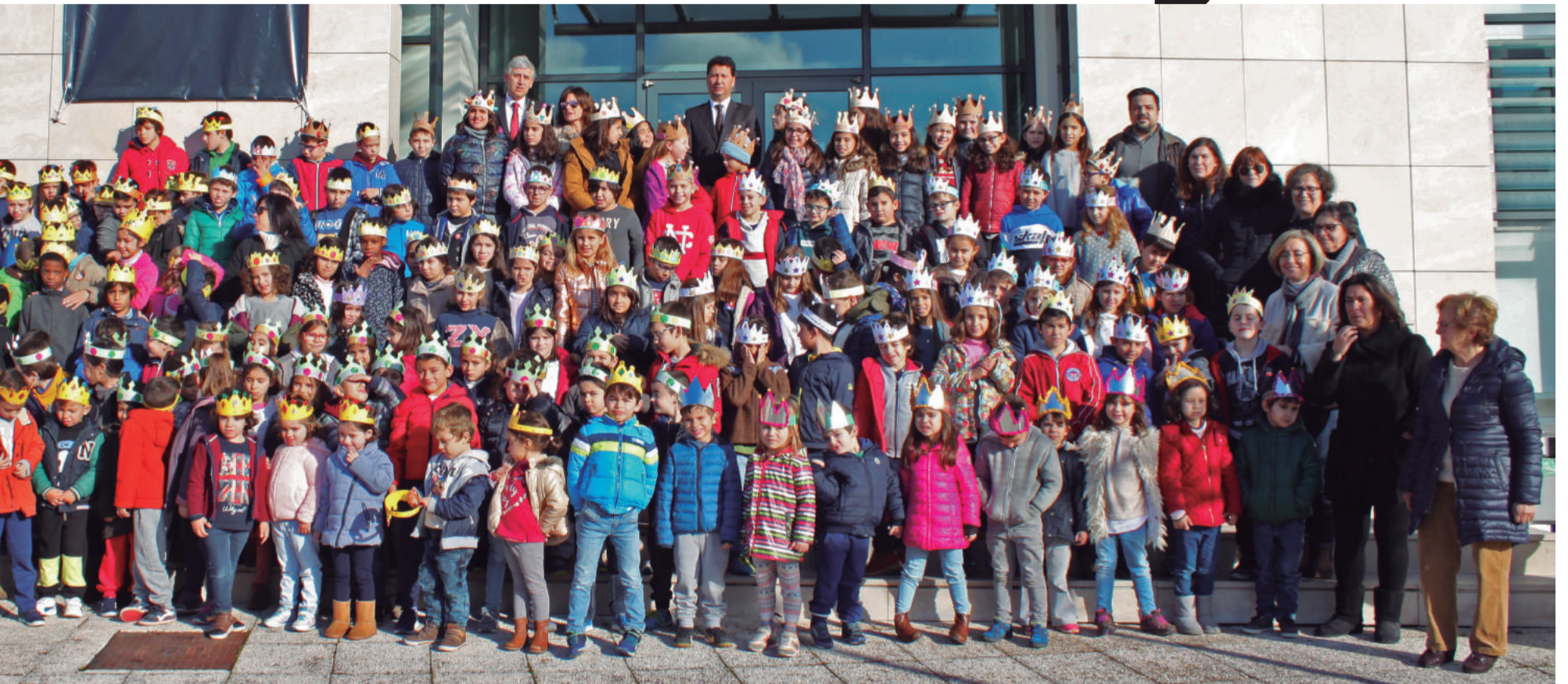
Centro Escolar da Caridade