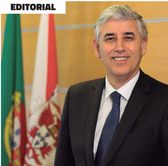
Luís Miguel Albuquerque