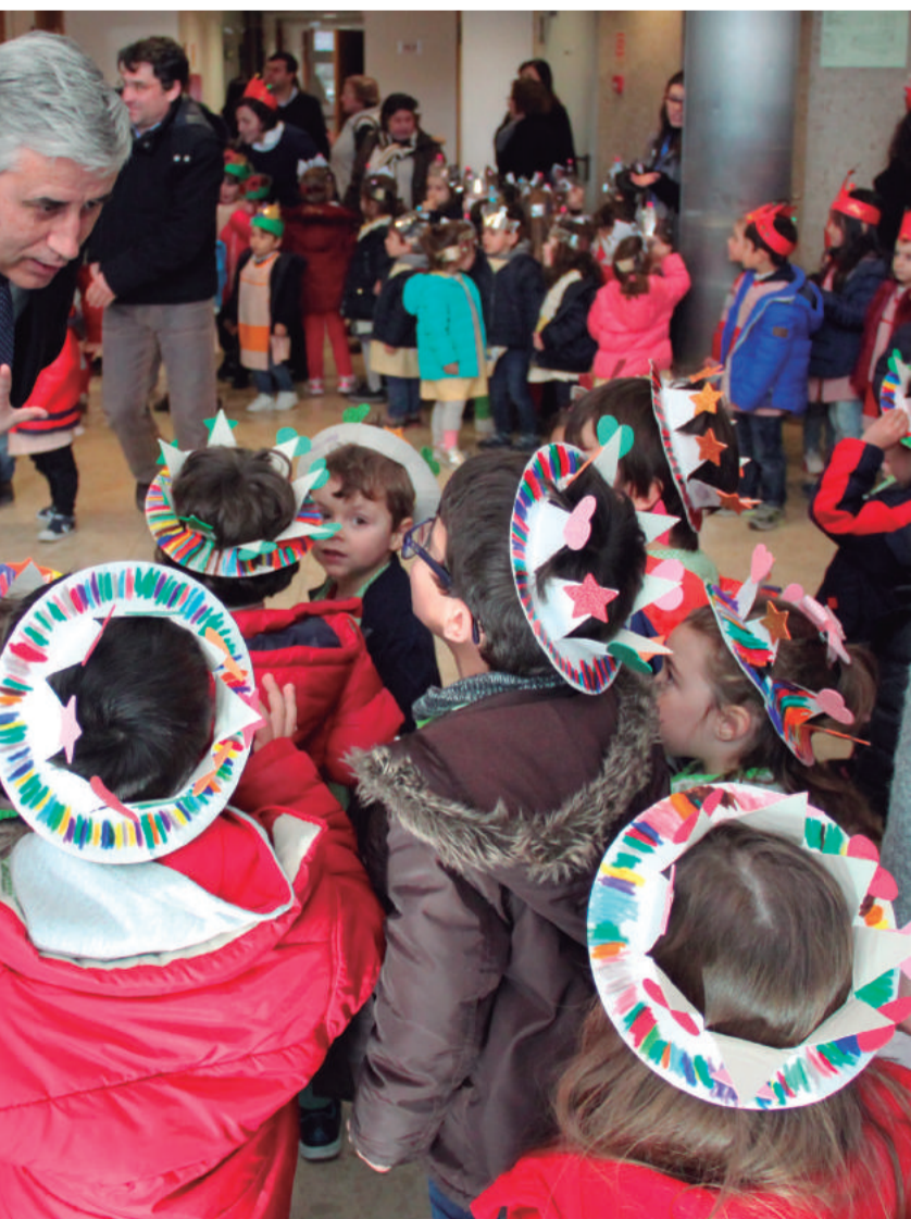
Centro Escolar de Santa Teresa (Pré-Escolar)