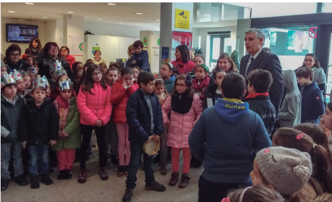
Centro Escolar de Santa Teresa (1.º Ciclo)

A tradição das janeiras voltou a cumprir-se em Ourém. Ao longo do mês de janeiro de 2018 foram várias as entidades, entre estabelecimentos de ensino e associações, que passaram pelo Edifício-sede do Município de Ourém para presentear o Executivo e funcionários com as tradicionais janeiras.