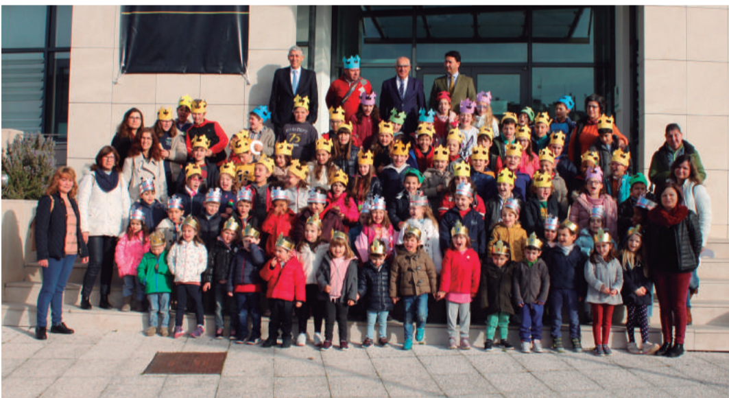
Centro Escolar Ourém Nascente