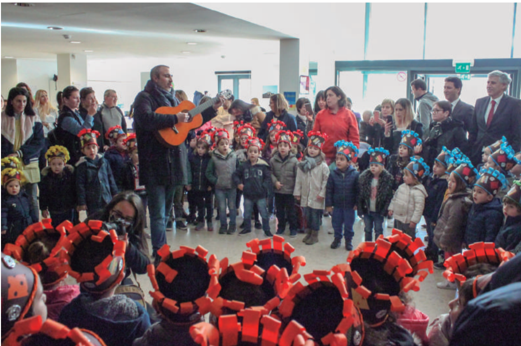
Jardim Infantil de Ourém